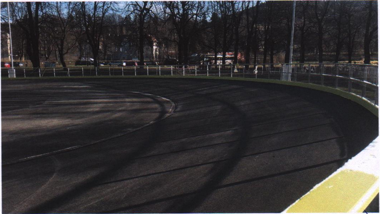
Przykład toru (bandy nie są częścią tego projektu)